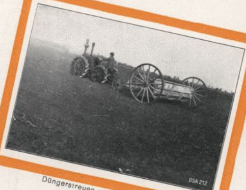
Düngerstreuen mit Lanz-Ackerbulldog