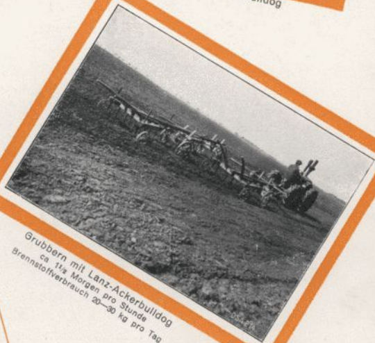
Grubbern mit Lanz-Ackerbulldog ca. 1 1/2 Morgen pro Stunde Brennstoffverbrauch 20–30 kg pro Tag