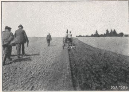
Saatfurche mit Lanz-Ackerbulldog ca. 1 Morgen pro Stunde. Brennstoffverbrauch 20–30 kg pro Tag